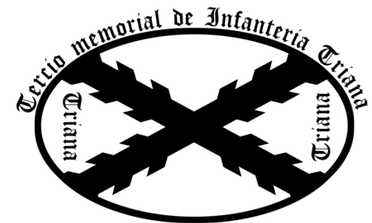
Escudo de la Asoc. basado en la bandera Original del tercio localizadas en la Parroquia de Manzanilla.

19:40-20:30: Presentación por parte de la Asociación Cultural Tercio de Infantería de Triana. Actividades de la Asociación Cultural Tercio de Infantería de Triana. Recibimiento de nuevos miembros, entrega de diploma a los asistentes. Acto de clausura.